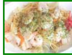
海鮮塩焼きそば 630円