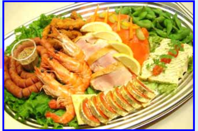
写真は4名様盛りの一例です。