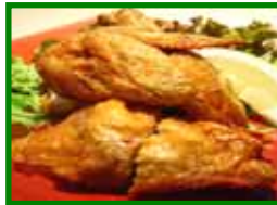
若鶏の豪快揚げ 950円