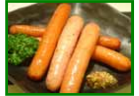
ソーセージ盛り合せ 650円