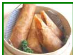
ぱりぱり春巻き 420円