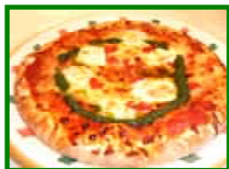
ピザ マルゲリータ 700円