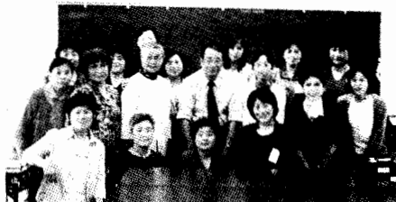
「オードリーの会」の仲間たち

外科医，日本乳癌学会認定医。1966年，長崎県大村市生まれ。1991年，大分医科大学卒業。趣味はテニス・天体観測・ギター。嫌いなもの：蜘蛛