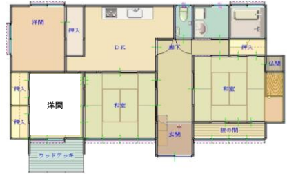
間取図は概略図です。現況が優先します。