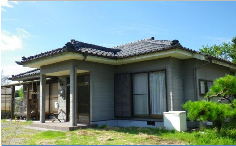
築13年の4DKの平屋住宅です。