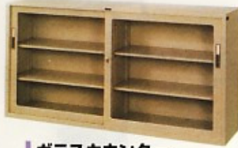
ガラスカウンター (スタンダード・HG) W1760×D400×H880