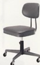
回転椅子 (肘なし) W400×D470×SH395~475