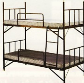
2段ベッド(マット別売) W1910×D910×H1760