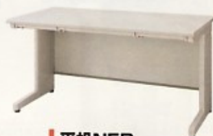
平机NED 107:W1000×D700×H700 127:W1200×D700×H700 147:W1400×D700×H700