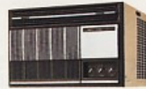
ウインドクーラー 1HP・1.5HP・2HP