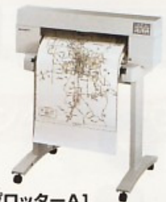
プロッター-A1 (スタンド・ロールフィードユニットはオプション) W1031×D232×H332(本体のみ) W1031×D730×H1031(オプション取付時)