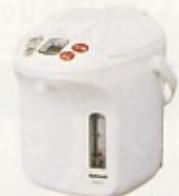
電気湯沸保温ポット 2.2ℓ