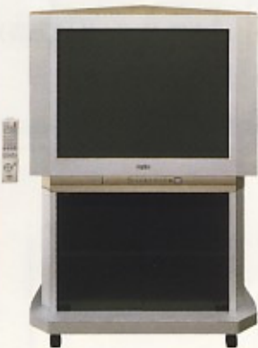
カラーテレビ・テレビ台 14型・19型