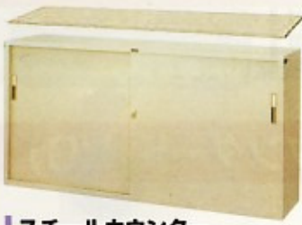
スチールカウンター (スタンダード・HG) W1760×D400×H880