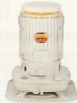
対流型ストーブ 4120kcal (5坪用)