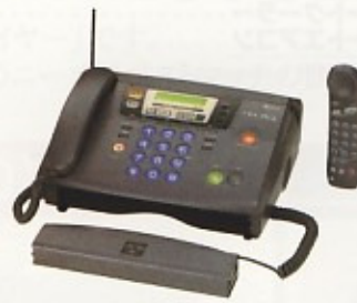
子機付ファクシミリ B4-B4