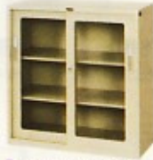
ガラス書庫 (スタンダード・HG) W880×D400×H880