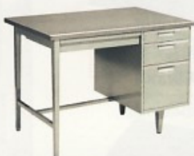
片袖机 (6号) W1060×D635×H740