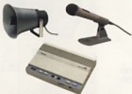
拡声機 (3点セット) アンプ・マイク・スピーカー 出力 30W