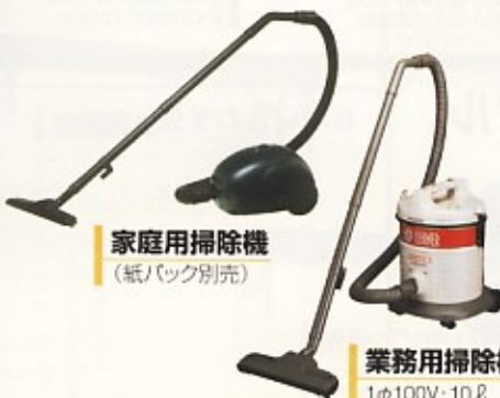
家庭用掃除機 (紙パック別売)