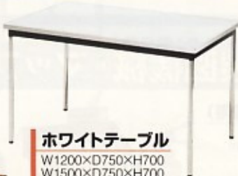
ホワイトテーブル W1200×D750×H700 W1500×D750×H700 W1800×D900×H700