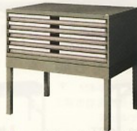
マップケーススタンド W978×D740×H508