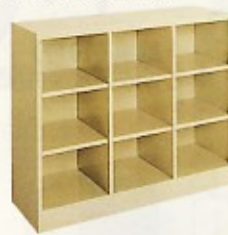
シューズボックス(9人用) W1070×D380×H880