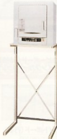
乾燥機(スタンド付) 4.0kg・5.0kg