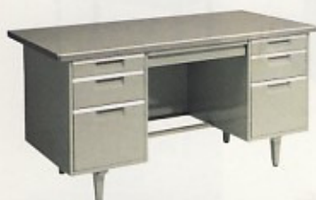
両袖机 (3号) W1370×D635×H740