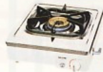
ガスコンロ LPG1口・2口