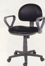
回転椅子HG (肘付) ガス圧昇降式 W460×D540×SH435~540