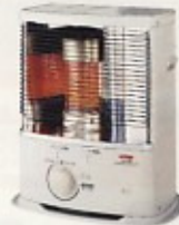
反射式石油ストーブ 2200kcal (3坪用)