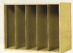
図面ファイルユニットA2用 W900×D450×H702