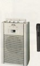
ワイヤレスアンプ・マイク カセット付 出力 20W