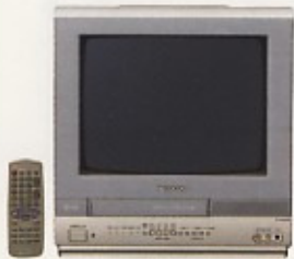
テレビデオ 14型・20型