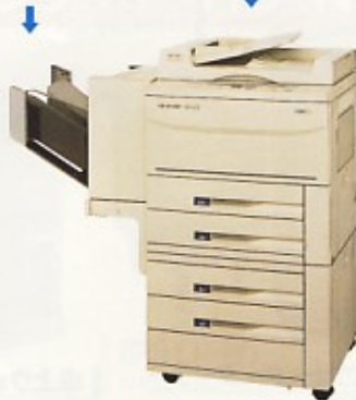
PPCコピー-A3フロント型 W900×D650×H1015