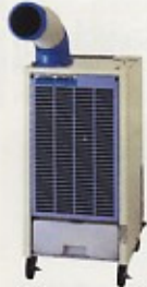
スポットクーラー 1HP 100V, 2300kcal