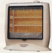
電気ストーブ 800W (1.5坪用)