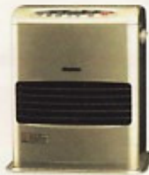
石油ファンヒーター 2500:590kcal~2580kcal (4坪用) 5000:1700kcal~5200kcal (8坪用)