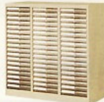
ルーミーケース B4(3列18段) W984×D400×H880