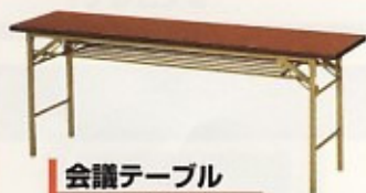
会議テーブル W1500×D450×H700 W1800×D450×H700 W1800×D600×H700 W1800×D900×H700