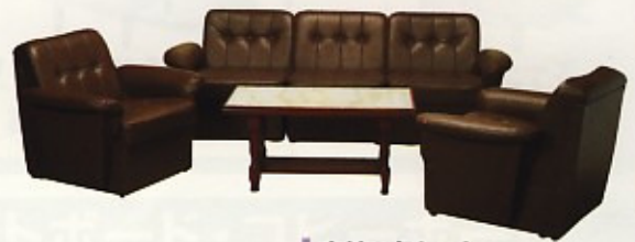
応接6点セット 両肘椅子:W860×D760×SH370 片肘椅子:W710×D760×SH370 肘無椅子:W560×D760×SH370 テーブル:W900×D440×H470