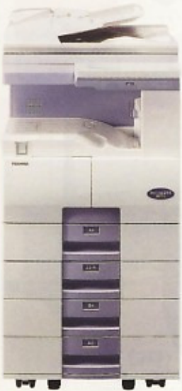
デジタル複合機 (FAXモデル) W627×D530×H1127