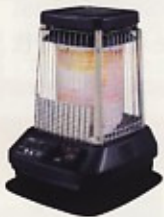
ブルーヒーター (ファン付) 4470kcal~15050kcal (20坪用)