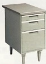
脇机 (10号) W405×D635×H740