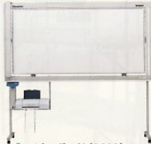
コピーボード (1800) (インクカートリッジ別売) H1860×W2000