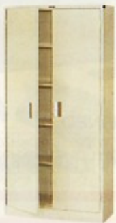
立型書庫 (スタンダード・HG) W880×D380×H1780