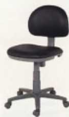
回転椅子HG (肘なし) ガス圧昇降式 W460×D540×SH435~540