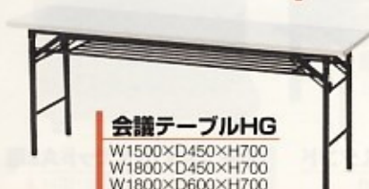
会議テーブルHG W1500×D450×H700 W1800×D450×H700 W1800×D600×H700