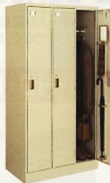
衣類ロッカー (3人用・4人用・6人用) W900×D515×H1790