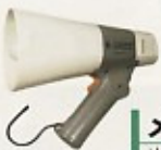
メガホン 出力 10W