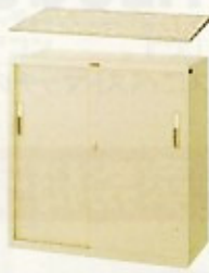
スチール書庫 (スタンダード・HG) W880×D400×H880