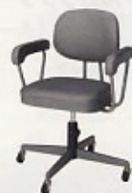
回転椅子 (肘付) W560×D495×SH395~475