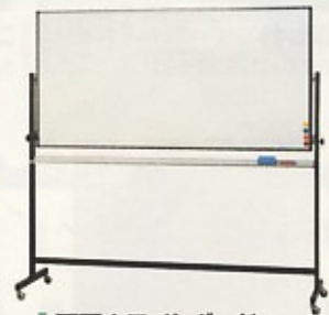
両面ホワイトボード 3×6 (スタンド付) 無地×無地・行事×無地・工程×無地