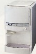
卓上ウォータークーラー タンク容量: 12ℓ