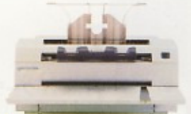
コピーA1サイズ(速乾式) 大きさ:W1008×D834×H456 複写幅A1・600mm. 電源AC100V・440W