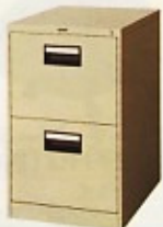
キャビネット A4-2:W388×D620×H740 B4-2:W458×D620×H740